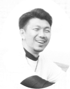
そだ ゆうし 曾田 雄志

桐蔭学園高を卒業後、清水エスパルスに加入。2002年ワールドカップ日韓大会では守備的MFとして4試合にフル出場し、ベスト16進出に貢献。その後は国内の複数クラブ、イングランドの名門トッテナム、オランダのADOデン Haag など海外でもプレー。13年限りで現役を引退。プロフェッショナルのカテゴリーで監督になる目標に向けて、18年からは慶應義塾大学サッカー部のコーチに就任。またサッカーを「言語化」しながら解説者として年間150試合以上の試合解説を担当。