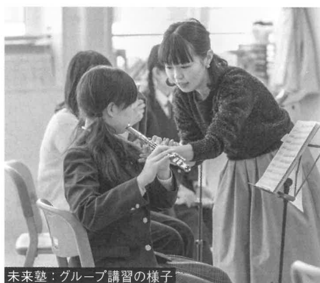
未来塾：グループ講習の様子