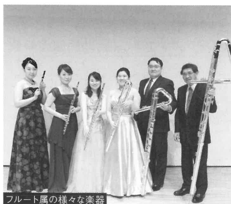
フルート属の様々な楽器