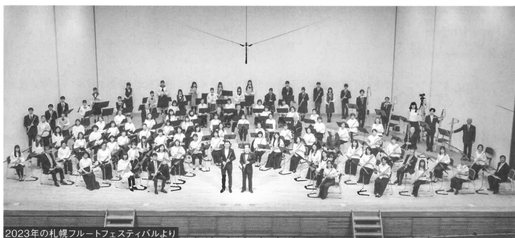
2023年の札幌フルートフェスティバルより