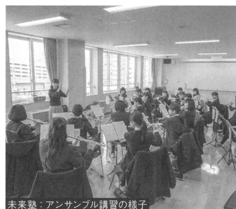
未来塾：アンサンブル講習の様子