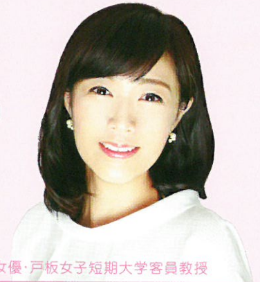
女優・戸板女子短期大学客員教授